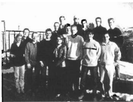
Ein Blick auf die FH Kiel

Professionalität, Qualität und Zuverlässigkeit sind Attribute, die vordergründig nicht unbedingt mit dem studierenden Teil der Bevölkerung in Verbindung gebracht werden. Seit zwölf Jahren lebt aber ESPRIT St.Gallen, die studentische Unternehmensberatung an der Universität St.Gallen, eben diese Grundsätze vor.